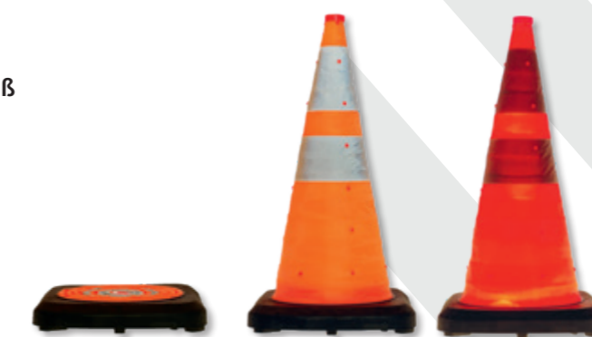
Faltkegel zusammengefallen Faltkegel aufgestellt Faltkegel beleuchtet

reflektierend und beleuchtet mit schwerem Fuß