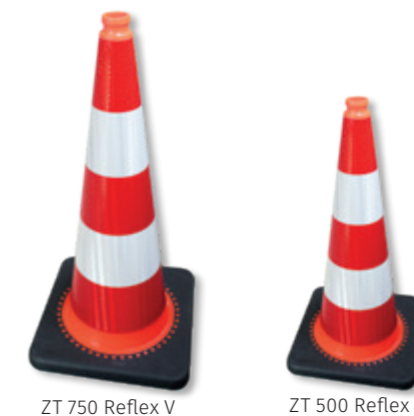
ZT 750 Reflex V