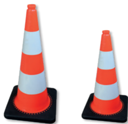
ZT Reflex 750