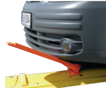
Leitboys mit flexiblem Fuß