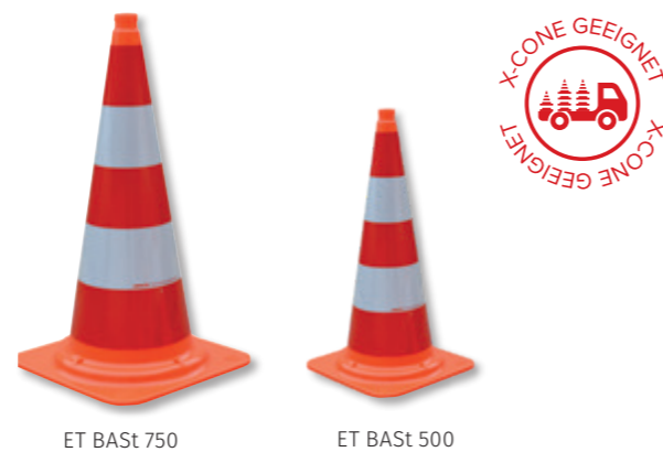
ET BAST 750