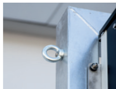
Transportösen 2 Stück (rechts/links)