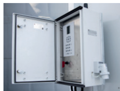
Steuereinheit mit LCD-Display inkl. G.T.M.S.