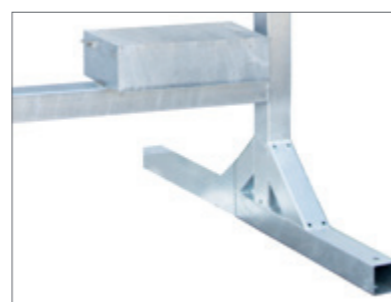
Der Standfußrahmen inkl. Akkukasten (für 1 Akku)